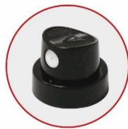
EROGATORE PRODOTTI VERNICIANTI NERO/BIANCO BLACK/WHITE PAINTING PRODUCTS ACTUATOR

Rompere il sigillo di sicurezza per aprire il tappo.